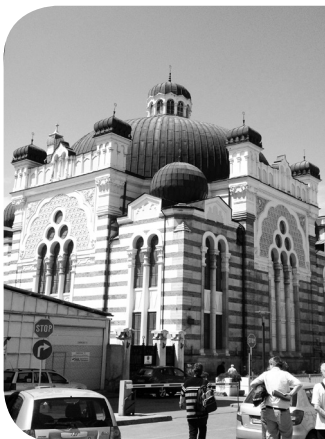
Synagogebesøg ifm. Journées d'Arras, Sofia