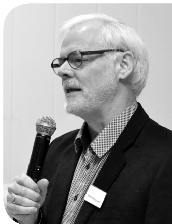
Steen Skovsgaard, biskop, KMS-konference 2013