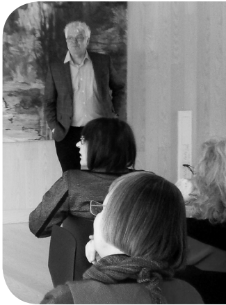
Islam Forum 2013, Ansgargården, Odense