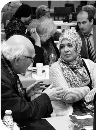
KMS-konference 2013, Dansk Islamisk Råd, Nørrebro