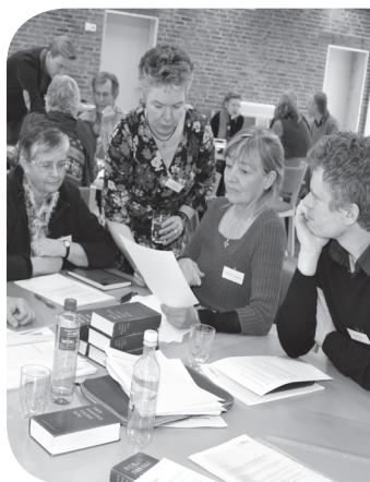
Inspirationsdag med stifts- udvalg vedr. religionsmøde, Hannerup Kirke

over bord. Dette kan vise sig at være en oplagt mulighed for folkekirken, men hvordan griber vi den an? Ja, mit bud er, at der sammen med et fokus på spiritualitet, stilhed og 'åndehuller', for såvel det fortravlede menneske som for det menneske, der slet ikke har noget at bestille, skal mere fokus på livstydning. Her bliver det afgørende at kunne indgå i en fælles refleksion med andre fagdiscipliner om, hvordan livstydninger og identiteter bliver til for moderne mennesker. Kort sagt, hvordan bliver mening og identitet til i 2014? Lige så vigtigt er det at opbygge evne til åbent at kunne belyse, hvad forskellige livstydninger betyder og herunder sagligt at kunne belyse, hvor de skiller sig fra hinanden, og hvor de har fælles perspektiver. Men det hele kommer til at foregå på individets præmisser og med mange andre mulige livstydninger inden for synsfeltet på samme tid. Til gengæld kan det vise sig, at klassiske discipliner som særligt undervisning og sjælesorg kan være mindst lige så relevante som et øget fokus på mere spiritualitet, hvis folkekirken skal være med til at skabe livstydning og mening i samtidsreligiøsitetens tidsalder.