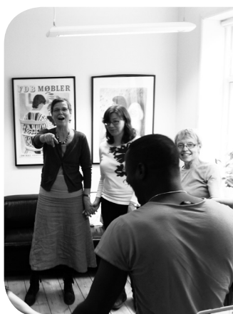
Folkekirkens Tværkulturelle Samarbejde, Odense