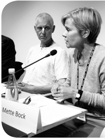
Debat om Grundlovens § 69, Danske Kirkedage, Aalborg