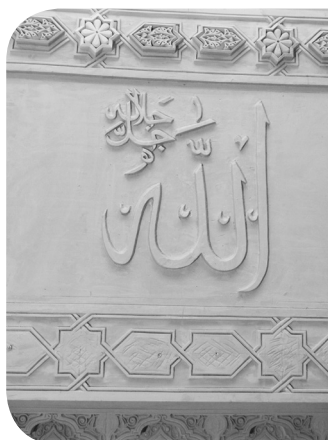
Rundvisning i Dansk Islamisk Råds nye moské, København

Konferencens deltagere var enige om at mødes igen d. 8. november 2014.