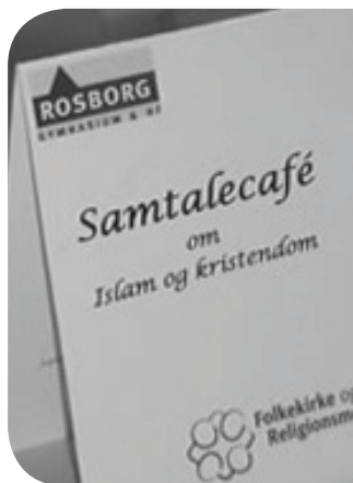
Menumark fra samtalecafeen på Rosborg Gymnasium