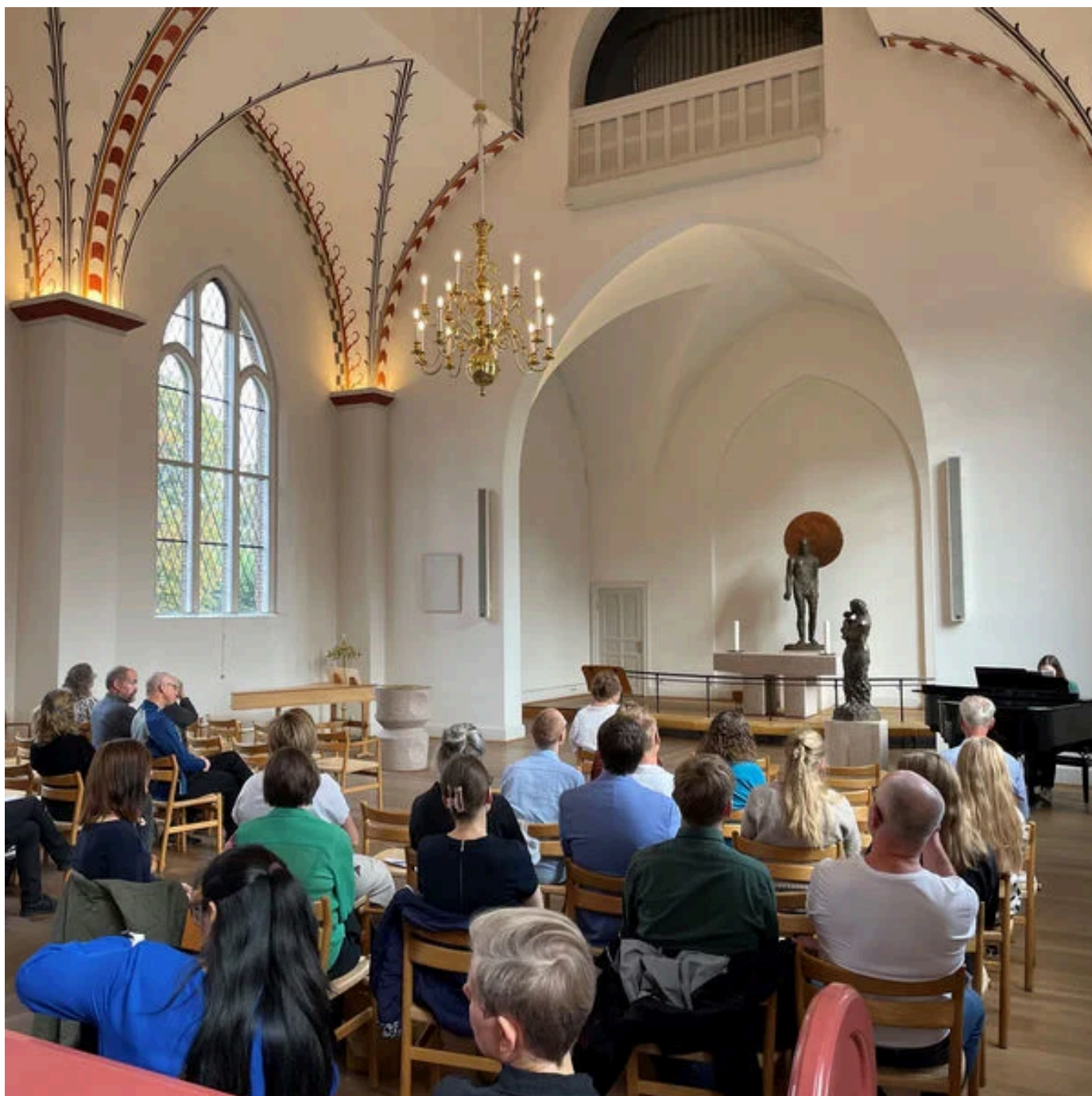
Morgensang i Søsterstuene på Diakonissestiftelsen.