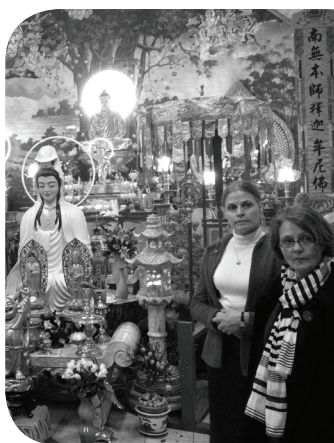
Præster besøger buddhisttempel i Tilst

Religionsteologisk Forum består af en række personer, der på forskellig vis arbejder med religionsmøde i Danmark. Religionsteologisk Forum arbejder med de særlige teologiske spørgsmål, som mødet med mennesker med anden tro stiller os overfor. Deltagerne arbejder i kirker, på universiteter eller i organisationer, hvor religionsmødet er på dagsordenen. Religionsteologisk Forum faciliteres i samarbejde med Center for