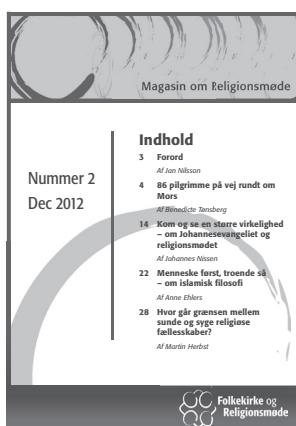
Magasin om Religionsmøde

De kirkelige organisationer på Diakonissestiftelsen arrangerer to gange om året "Organisationernes Dag", hvor de studerende fra Pastoralseminariet i København deltager. Arrangementet er med til at øge de studerendes kendskab til de frie folkekirkelige organisationer og institutioner. F&R deltager i Organisationernes Dag og fortæller her om F&R's arbejde og generelt om erfaringer med religionsmøde i folkekirken.