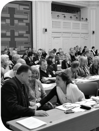
Høring om religionsmødet i anledning af F&R's 10 års jubilæum, Landstingssalen, Christiansborg