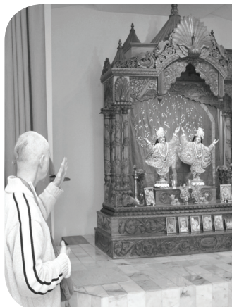
Hare Krishna, Vanløse