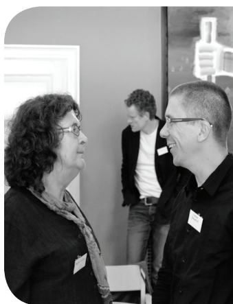
Nordisk Religionsdialog- konference, Vartov

Siden etableringen af F&R i 2002 er der vokset rigtig meget dialogarbejde op rundt omkring i alle hjørner af folkekirken. Dengang var det stort set udelukkende engagerede enkeltpersoner, der sørgede for, at der blev etableret fora og arbejdsformer for religionsmøde i folkekirken. I dag har vi i folkekirken formået at få prioriteret flere ressourcer til religionsmødearbejde i form af funktionspræster for religionsmøde og fysiske mødesteder i flere større byer, og menighedsråd har indskrevet religionsmødet