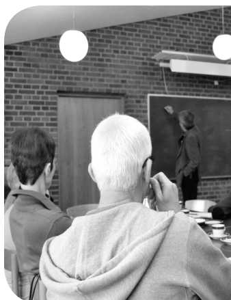
Samling i Sognelæringsnetværk Jylland, Nørremarkskirken i Vejle

Det er menighedsrådene i de enkelte sogne, som har tilmeldt sognet til at deltage i netværket. Der deltager to personer fra hvert sogn, hvoraf mindst den ene er lægperson. Netværket mødes i alt fire gange. Derudover er der en ekskursion til Sverige i foråret 2013.