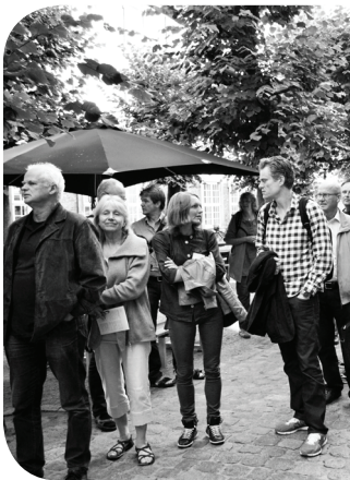
Nordisk Religionsdialogkonference, Vartov

Den 29. maj-2. juni deltog generalsekretæren i en konference i netværket Journées d'Arras i Puidoux i Schweiz. Journées d'Arras er et europæisk og økumenisk netværk for personer, der arbejder med kirkelig islamdialog i Europa. I 2013 mødes netværket Journées d'Arras i Bulgarien.