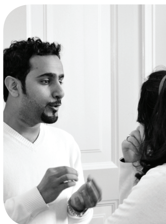
Konference i Leaders for Interreligious Understanding, København

som fokusområde i deres vision. Stiftsudvalg sørger i mange stifter for grundlæggende inspiration, teologisk refleksion og alverdens spændende tværgående arrangementer, der skaber langt mere religionsmøde end tidligere. Siden 2009 har F&R i samarbejde med Teologisk Pædagogisk Center udviklet to nye efteruddannelse for præster, hvor fokus har været folkekirkens møde med hhv. islam og nye spirituelle strømninger. Indtil videre har 32 præster gennemgået en fire ugers efteruddannelse med fokus på religionsmøde.