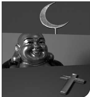
DE ANDRE, OS OG VORHERRE Inspirationsmateriale til folkekirkens arbejde med religionsmødet

F&R og Bibelselskabet indgik i 2004 i et samarbejde om at udvikle en idé om en “startpakke” til kristendommen. Formålet er at formidle basal viden om kristen tro og give konkrete anvisninger om kristen praksis. Dette projekt har desværre vist sig at være vanskeligt at gennemføre. F&R håber at kunne gennemføre det på en anden måde, eftersom der var stor opmærksomhed om projektet.