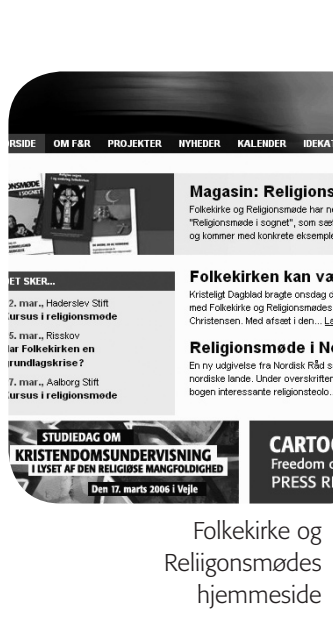
Folkekirke og Religionsmødes hjemmeside

Fra december 2006 vil der månedligt blive udsendt et elektronisk nyhedsbrev fra F&R.