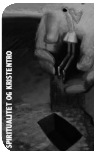
Inspirationsdage i Viborg og Grenaa om spiritualitet og kristentro

Baggrunden for konferencen var den stigende interessen for at arbejde med spiritualitet i folkekirken. Formålet var dels give inspiration, dels at bygge bro mellem kirken og religiøst søgende, som kommer med erfaringer fra andre religioner i bagagen, og dels at bidrage til afklaringen af, hvad der er det karakteristiske for en kristen spiritualitet, og hvordan den er