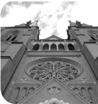
Folkekirke og Religionsmøde - et samarbejde mellem stifter i folkekirken

Lolland-Falster Stift: Møde med stiftsudvalget for mission og introduktion til F&R.