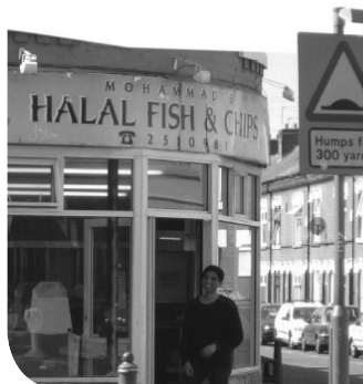
Studietur til Leicester, april 2005