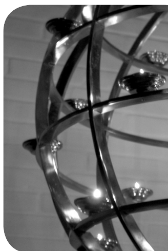
Nyt hæfte om folkekirkens møde med den åndelige søgen

F&R og Bibelselskabet har i 2004 arbejdet med at udvikle en idé om en »startpakke« til kristendommen. Formålet er at formidle basal viden om kristen tro og give konkrete anvisninger om kristen praksis.