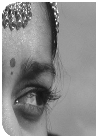
Kursus og rejse til Indien i samarbejde med Teologisk Pædagogisk Center

I samarbejde med Teologisk Pædagogisk Center er vi i færd med at planlægge et forløb af stiftskurser af to dages varighed i alle stifter, på Bornholm og i Sydslesvig i februar og marts 2006. Vinklingen på kurserne er dels religionsteologisk og dels religionspædagogisk, og de henvender sig til præster, sognemedhjælpere, lærere og andre interesserede.